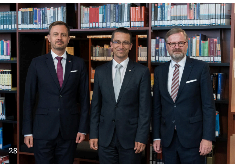
22 - 26 Den Fakulty sociálních studií MU 27 - 28 Začátkem června fakulta přivítala vzácné hosty - premiéra Petra Fialu a slovenského premiéra Eduarda Hegera.